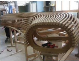
Bank in Bendywood®- Eiche