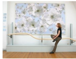
Organon in Bendywood®- Esche